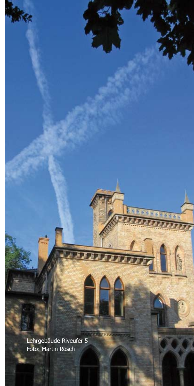
Lehrgebäude Riveufer 5

Der Unterricht wird in Unterrichtsblöcken organisiert. Der allgemeine Bereich ist in beiden Fachrichtungen identisch. Im Differenzierungsteil erfolgt die Ausbildung nach den Schwerpunkten der entsprechenden Fachrichtung. Zwischenprüfungen und staatliche Abschlussprüfungen werden in mündlicher, schriftlicher und praktischer Form abgelegt.